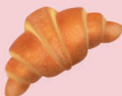
Medialuna (112 g) $32