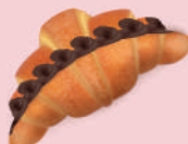
Medialuna Ferrero (212 g) $56