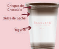
Yogurt Power (275 g) $76