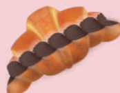
Medialuna con Dulce de Leche (193 g) $56