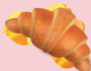
Medialuna de Jamón y Queso o solo Queso (1186 g) $73