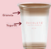
light Power (275 g) $76